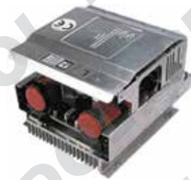
Impianto SME Bimotore