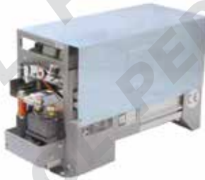
Impianto SME Mono