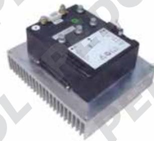
Impianto AC2 Zapi Om E20/25/30 AC

N.B. Quelli rappresentati sono soltanto alcuni esempi delle riparazioni possibili, contattateci per ulteriori richieste