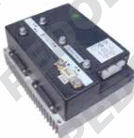
Impianto AC3 Zapi Om E20/25/30 AC