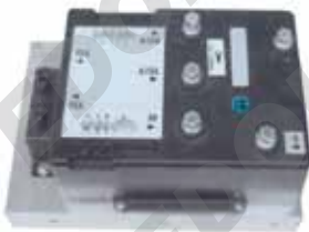
Impianto potenza Zapi Om XE12/15/18/20 AC