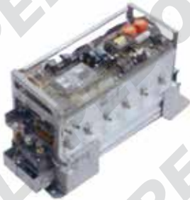
Impianto SME FASE